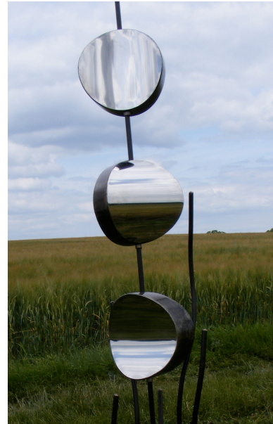
acier inox 180x45x35