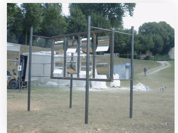
acier inox 300x300x200