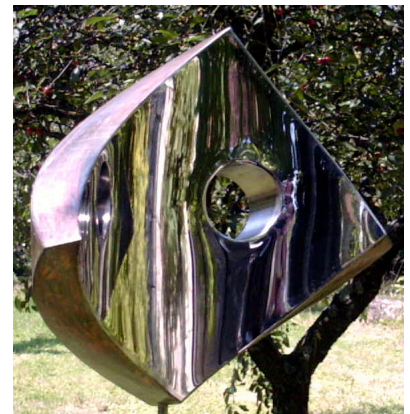
acier inox 155x50x30