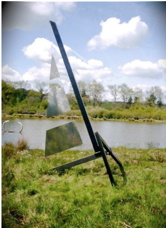
Images voilées 480x300x250