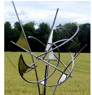
acier inox 170x70x70