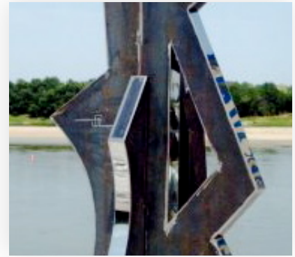
acier inox 200x160x160