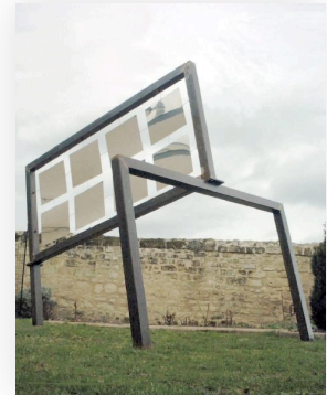
Grand projecteur 300x300x250